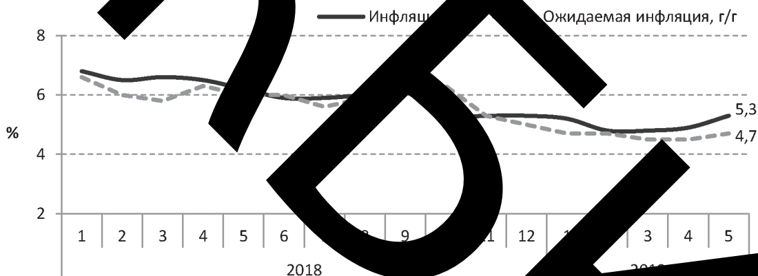
График 1. Инфляция и ожидаемая инфляция